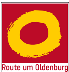
Beschilderung des Ringweges

„Pfeilwegweiser“ geben in Kreuzungsbereichen über zurückzulegende Entfernungen und Fahrrichtungen Orientierung. Zudem informieren eingehängte „Routen-Symbole“ über den Verlauf der Themenrouten bzw. Radfernwege. „Tabellenwegweiser“ geben an größeren Knotenpunkten schon vor dem Kreuzungsbereich Informationen über die weitere Fahrtrichtung.