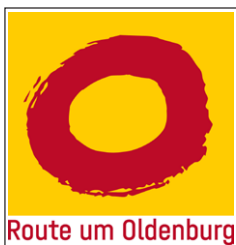
Beschilderung der Speichen